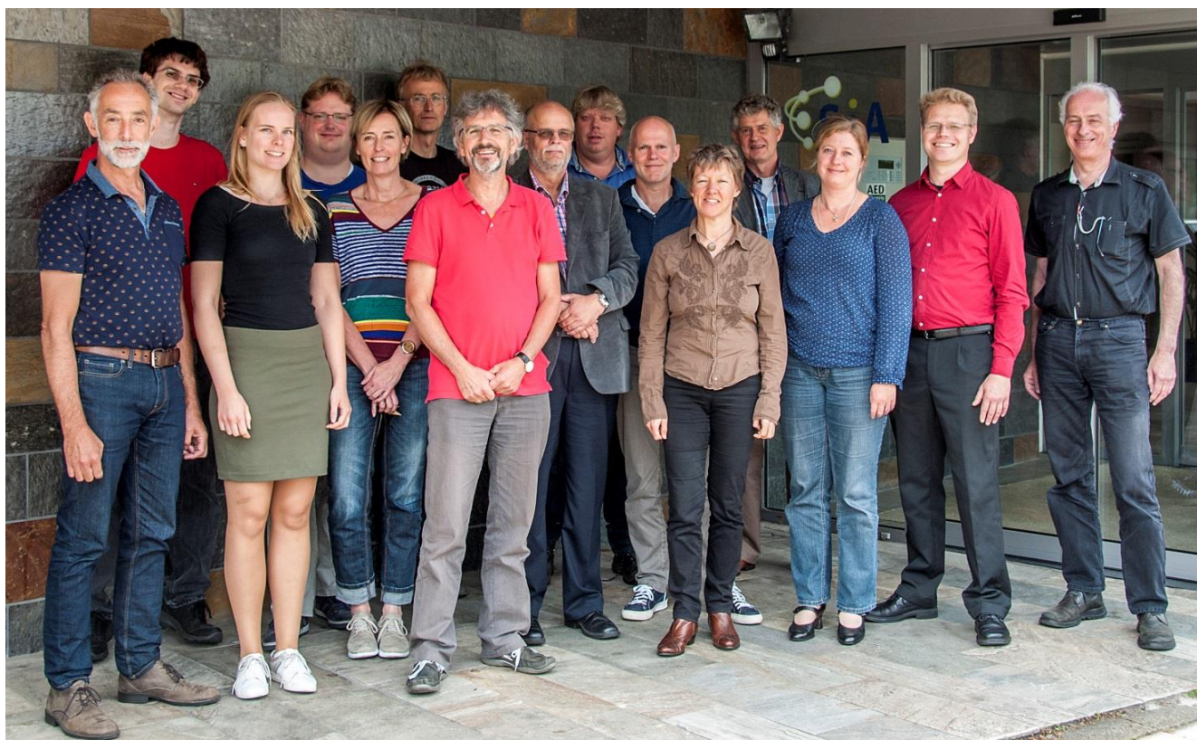
De nieuwe COR